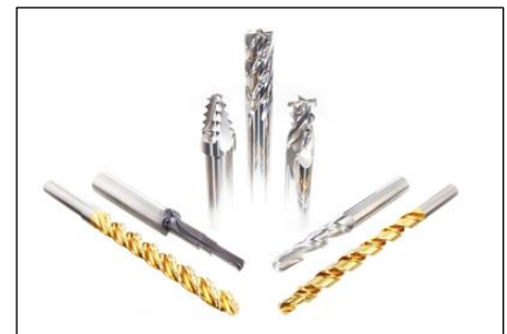
Sonderwerkzeuge nach Zeichnung

Sonderwerkzeuge konstruieren wir mit CAD-Programmen und fertigen sie als Einzelstück oder Kleinserie. Dabei entscheiden wir je nach Anwendung individuell: Entweder setzen wir Neuwerkzeuge als Vormaterial ein und passen sie Ihren Anforderungen resp. Zeichnungen an (Stufen, Fasen, Radien, Formen) oder wir fertigen die speziellen Fräs- und Bohrwerkzeuge von Grund auf neu. Wir führen ein grosses Lager an präzisen Rundstäben in VHM und HSS.