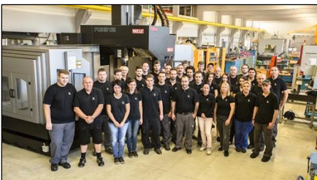
Das Team der MDP Meili AG

Mit umfangreichen und fortschrittlichen Fertigungsmöglichkeiten ist die vor 22 Jahren gegründete MDP Meili AG in der Lage, die komplexesten Anforderungen zu meistern. Rund 50 CNC-gesteuerte Maschinen stehen in den Hallen des Unternehmens in Ramsen. Sie gewährleisten einen rationalen und sicheren Produktionsablauf.