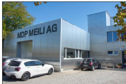
MDP Meili Firmensitz in Ramsen

Durch die grosse Fertigungstiefe sind die Mitarbeitenden in der Lage, beinahe alle Produktionsschritte im eigenen Haus auszuführen. Dank dem Know-how und der Erfahrung im Umgang mit den unterschiedlichsten Teilegrössen fertigen 42 Fachleute (davon 7 Lernende) sehr schnell und effizient. Sie bearbeiten alle Materialien und liefern der Kundschaft ihre Teile inklusive Oberflächenbehandlung. Auf Kundenwunsch wird auch ein ausführliches Messprotokoll mitgeliefert.